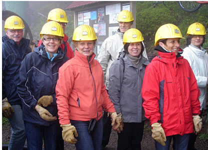
Ein etwas anderes Konzerttenü: Vor dem Abstieg in die Silbermine

eingängigen Melodien fanden sowohl der Chor mit den Solisten als auch das Publikum grossen Gefallen. Das kalte Wetter und die fehlende Bekanntheit von CantaSense im Schwarzwald hatten zur Folge, dass in Waldkirch nur ca. 35 Personen ans Konzert kamen. Aber ihr Applaus war so herzlich und frenetisch, als ob sie zu Hunderten geklatscht hätten.